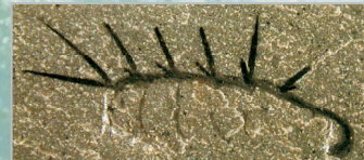
Hallucigenia , l'un des fossiles retrouvés dans les schistes de Burgess

Diversification intense des formes de vie