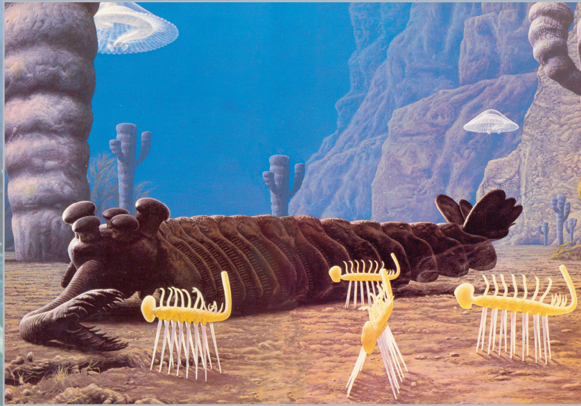
Quelques représentants de la faune de Burgess (reconstitutions, Hallucigenia au premier plan)