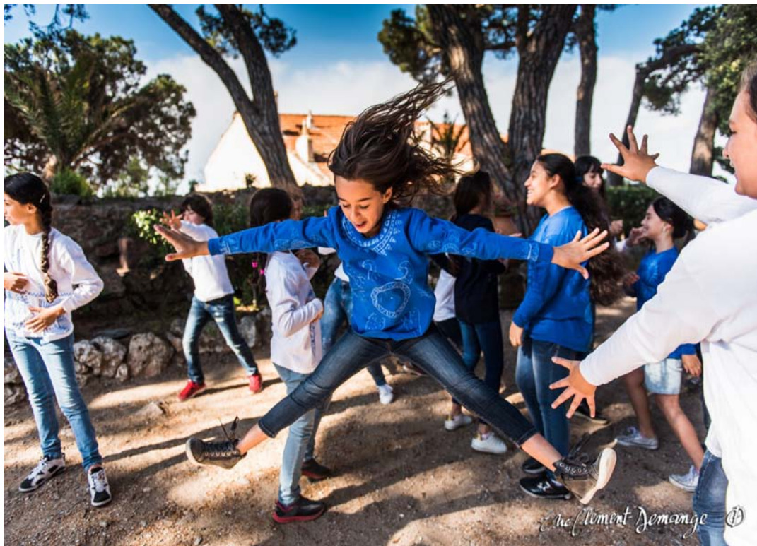
© Reveïda, A la manière Kaléidoplastique

Musée International de la Parfumerie à Grasse, ville de Cannes, réseau Canopé, DRAC PACA : réalisation d'un film de danse à partir de la création Esperluette Danse avec la Peau des Mots avec 2 classes de CM1-CM2 en territoire prioritaire à Nice.