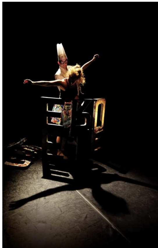
© Reveïda - Esperluette Danse avec la Peau des Mots - photo : Rémy Masségia