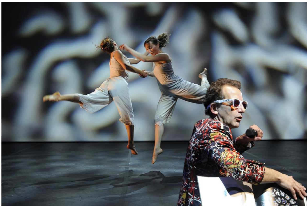
© Reveïda, Le Kaléidoplastique Quizz - photo : Nathalie Sternalski

la Fabrique Mimont et Système Castafiore en 2016, 2017 et 2018.