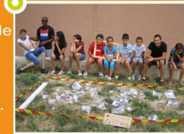
Cités débrouillardes 2011 - La Paternelle, Marseille

Le libre accès des animations, la souplesse de la formule et la qualité des animations proposées font de cette semaine un véritable temps fort dont bénéficie tout le quartier. Les habitants, les commerçants et les partens sont invités à y participer contribuant ainsi à sa réussite.