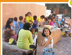
Cités débrouillardes 2006 - Val Plan, Marseille

Chaque semaine sera clôturée par une exposition des réalisations des participants, accompagnée d'un goûter festif .