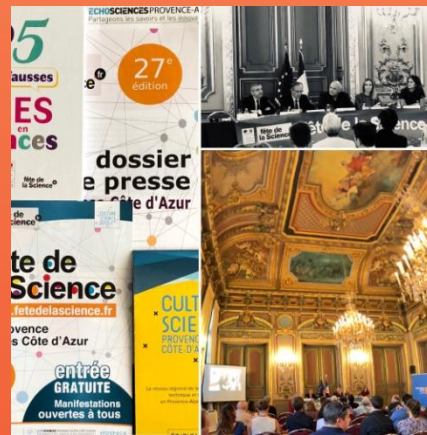
Photo C.Rodo, jeune chercheur en neurosciences et Live Reporter 2018